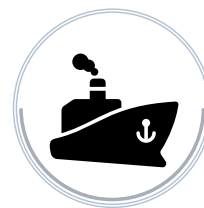
СУДОСТРОЕНИЕ И СУДОХОДНЫЙ РЕМОНТ