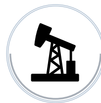
НЕФТЕПЕРЕРАБАТЫ- ВАЮЩИЕ ПРЕДПРИЯТИЯ