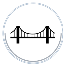
МОСТЫ И ТОННЕЛИ