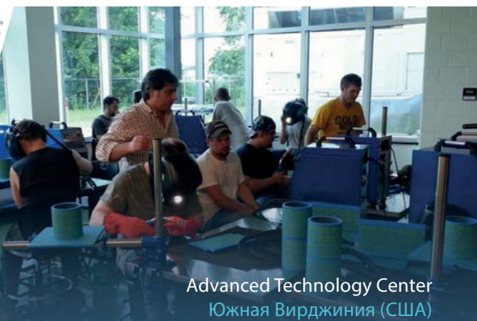
Advanced Technology Center Южная Вирджиния (США)