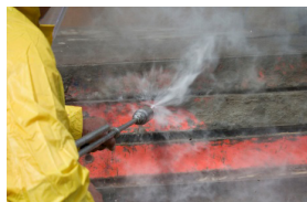
ТУРБОБЛАСТЕР Реактивная гидрофреза, очистка тяжёлых загрязнений