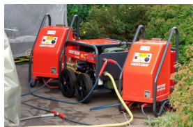
HOT BOX Модуль нагрева