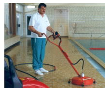
Устройство очистки полов