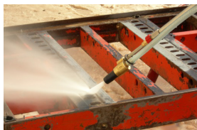
TORNANO Водопескоструйная очистка поверхности