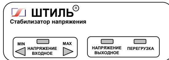
Рисунок 4.1 Передняя панель стабилизатора

На одной боковой стенке стабилизатора расположена розетка с заземляющим контактом для подключения нагрузки, а на другой – автоматический предохранитель 2А (у стабилизатора R250T) или 5А (у стабилизаторов R400T – R800T), выключатель СЕТЬ и выведен сетевой шнур для подключения стабилизатора к сети.