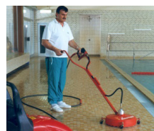
Устройство очистки полов